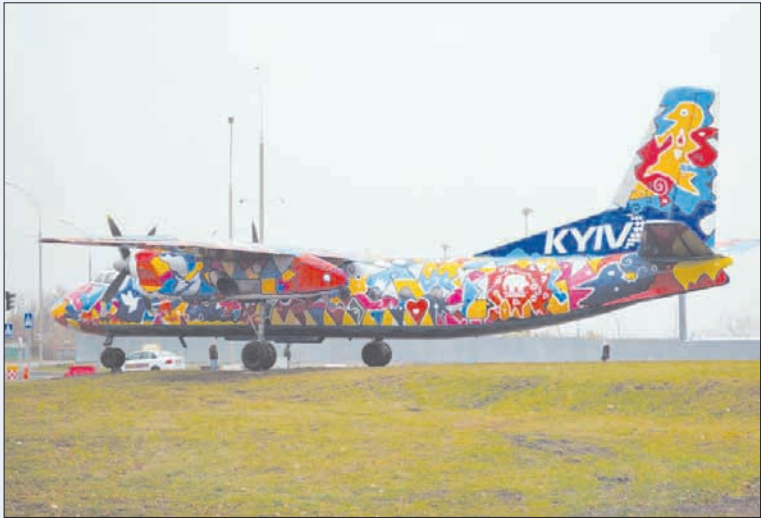
В аеропорту «Київ» легендарний Ан-24 – «робочу конячку» авіації – перетворили на витвір мистецтва. Два тижні знадобилося грузинському художнику, щоб старенький літак став арт-об'єкт.